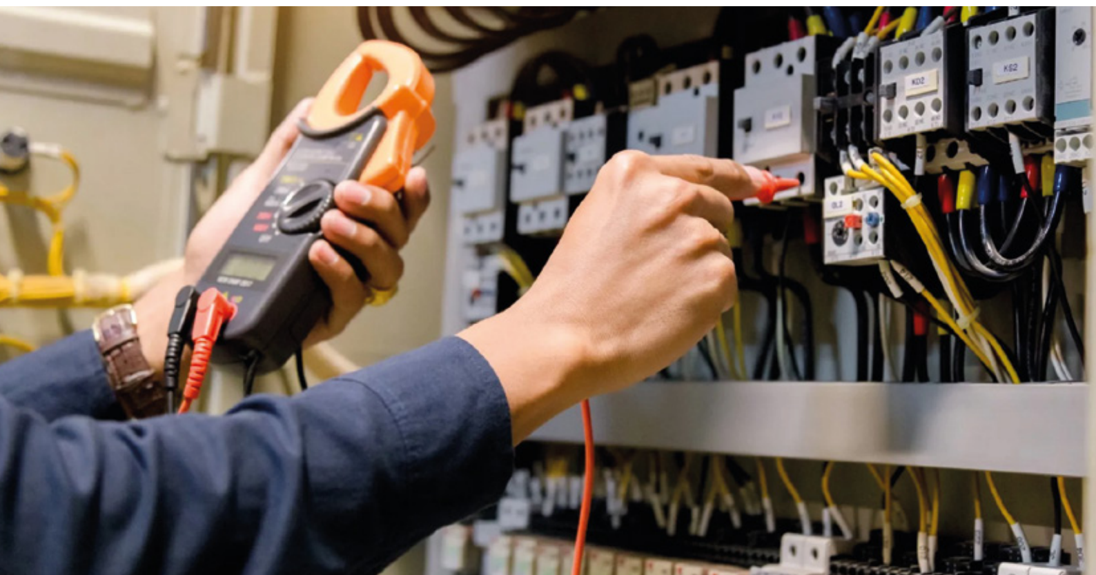
Figura professionale: Operatore dell'installazione e manutenzione di impianti elettrici